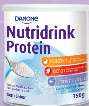
PÓ SEM SABOR

Nutridrink auxilia na adesão ao tratamento oncológico 1,2