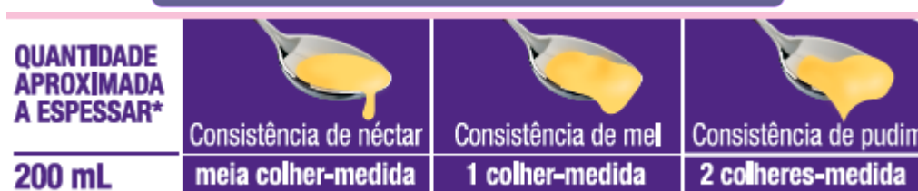
Tabela com informações nutricionais

* A quantidade de Nutlis Clear necessária pode variar ligeiramente, dependendo da temperatura ou consistência dos líquidos a que é adicionado, assim como da viscosidade pretendida.